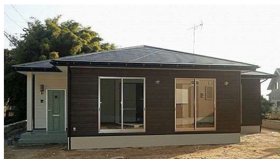
(別の土地に建っている同タイプの建物で