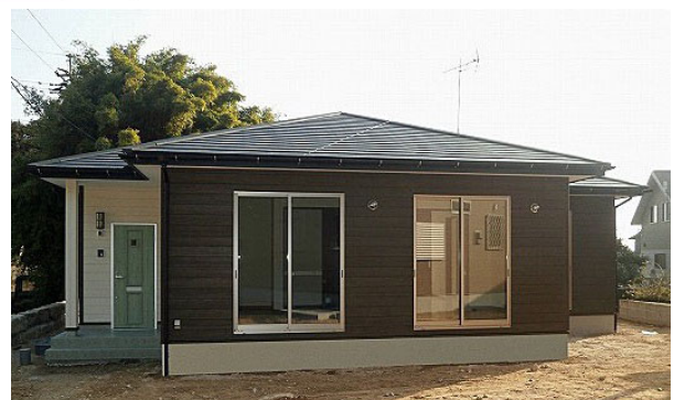
(別の土地に建っている同タイプの建物です)